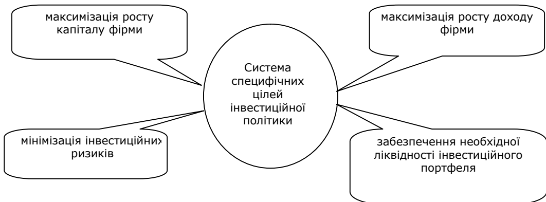
Рис. 2. Система специфічних цілей інвестиційної політики

Залежно від спрямованості інвестиційної політики та особливостей організації інвестиційної діяльності підприємство може визначати систему специфічних цілей (рис. 2).