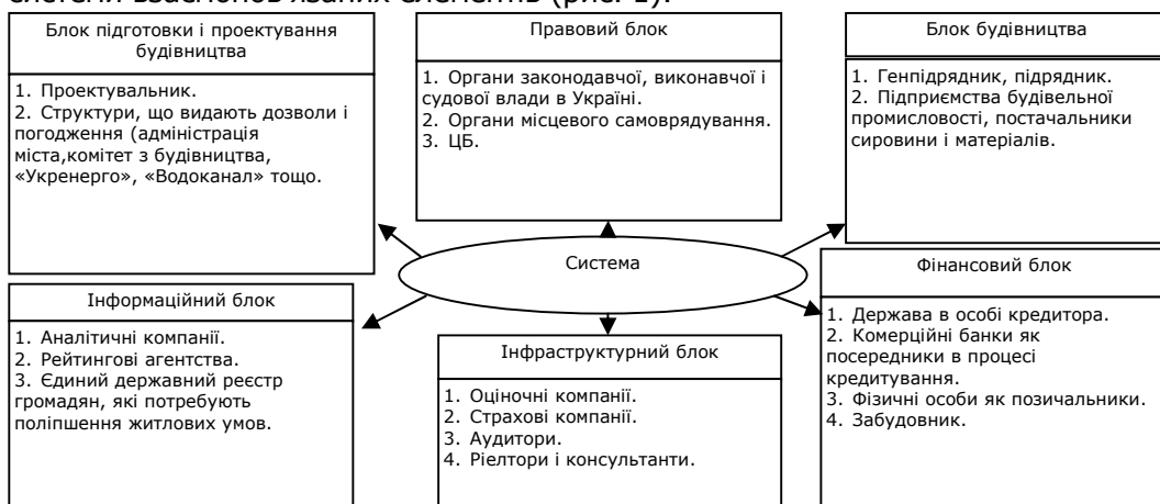
Рис.1. Система державного інвестиційного кредитування молодіжного житлового будівництва

На нашу думку, інвестиційний процес державного інвестиційного кредитування молодіжного житлового будівництва можна зобразити у вигляді системи взаємопов'язаних елементів (рис. 1).