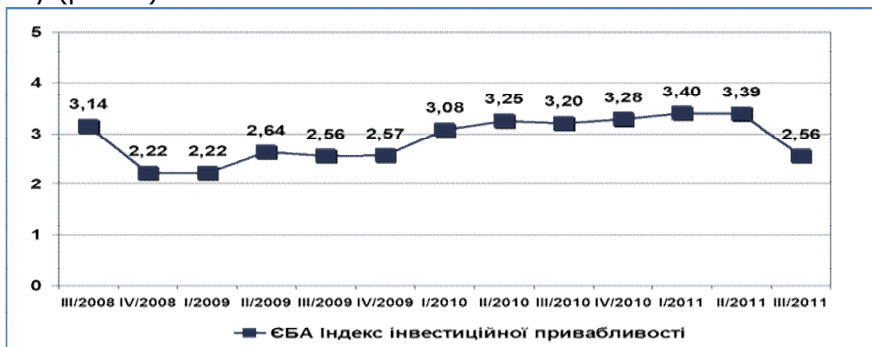
Рис. 1. Динаміка індексу інвестиційної привабливості

Індекс інвестиційної привабливості України, який обраховує «Європейська бізнес-асоціація» (ЄБА), свідчить, що рівень довіри українських інвесторів у третьому кварталі 2011 року знизився до рівня 2,56 за 5-бальною шкалою вперше за 2 роки, таким чином впавши до рівня показників третього кварталу 2009 року (рис. 1).